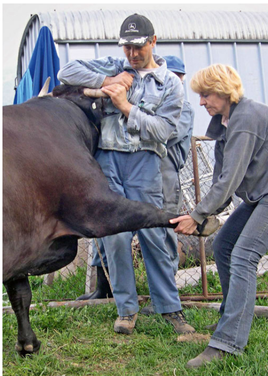
Image: Vérification de la mobilité de l'épaule d'une vache d'Hérens.